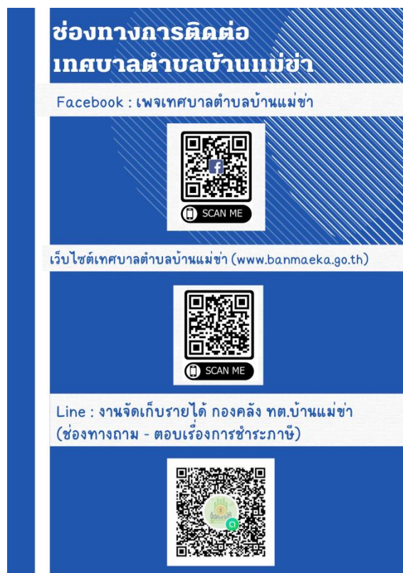
รูปแบบสื่อประชาสัมพันธ์ที่ใช้ในการเผยแพร่ช่องทางการติดต่อข้อมูล