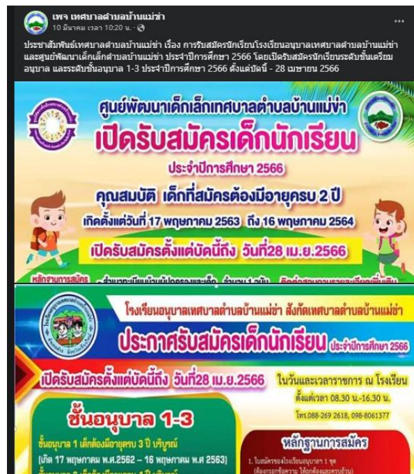
ตัวอย่างการประชาสัมพันธ์ข้อมูลข่าวสารผ่านทาง Facebook Page