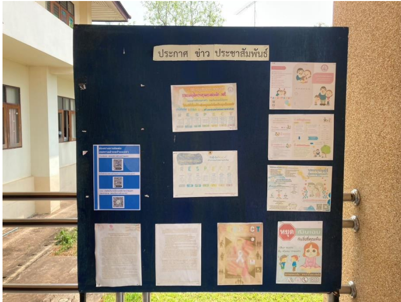
ตัวอย่างการเผยแพร่ข้อมูลข่าวสารผ่านช่องทางต่างๆ