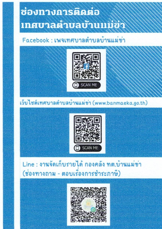
รูปแบบสื่อประชาสัมพันธ์ที่ใช้ในการเผยแพร่ช่องทางการติดต่อข้อมูล