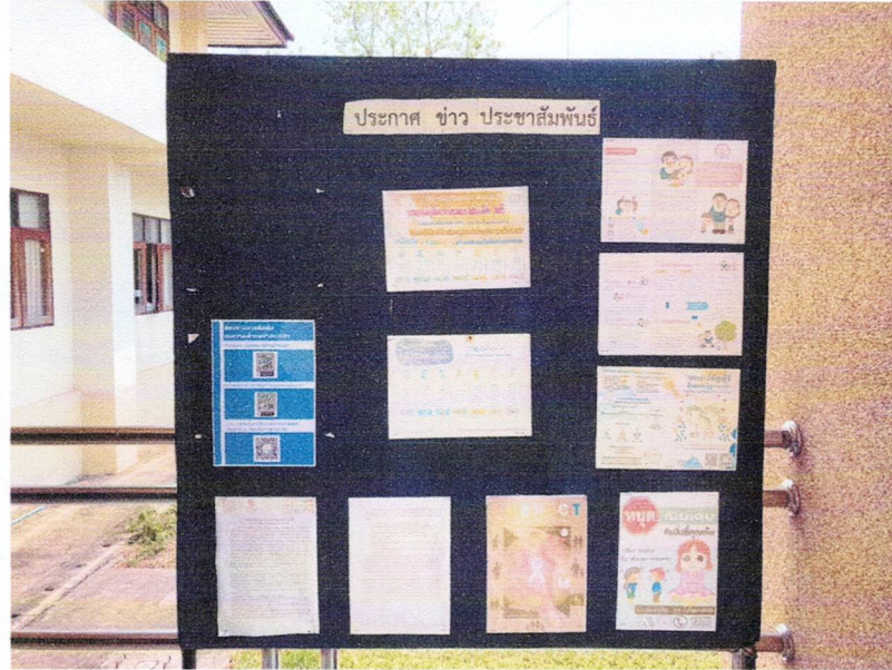
ตัวอย่างการเผยแพร่ข้อมูลข่าวสารผ่านช่องทางต่างๆ